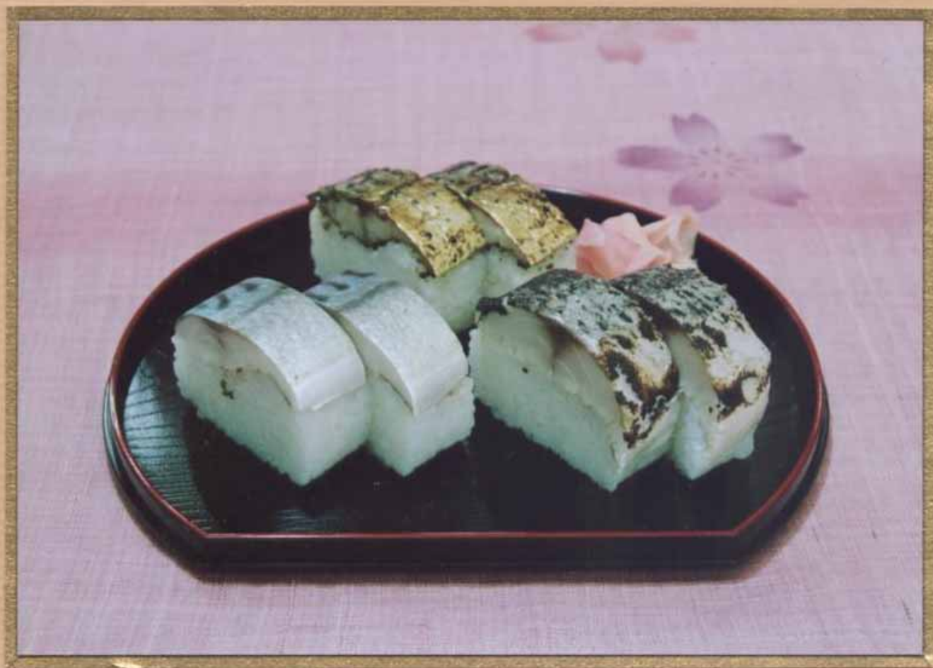
写真（鯖ずし、鯖スモークずし、トロ鯖のたたきずし）